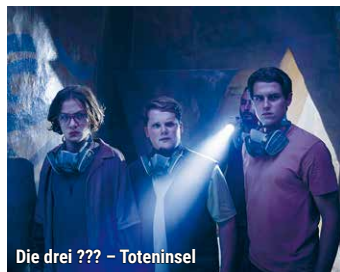
Die drei ??? – Toteninsel

Statt sich in den Ferien eine Pause vom Detektivleben zu gönnen, stürzen sich die drei ??? lieber in den nächsten Fall. Ein anonymes Anruf führt sie zu einem Geheimbund, der Kunstschätze aus illegalen Ausgrabungen verkauft. Um der Bande rund um den Archäologen Phoenix das Handwerk zu legen, machen sich Justus, Peter und Bob auf eine gefährliche Reise zur sagenumwobenen Toteninsel – von der noch nie jemand lebend zurückgekommen sein soll. Fr. 3.4., Sa. 4.4., So. 5.4. + Mo. 6.4. / 15:00 // Sa. 11.4. + So. 12.4. / 15:30