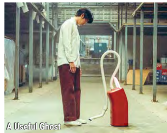
A Useful Ghost

WOMEN DEFEND ROJAVA • Sa. 11.4. / 18:00 * mit Gästen