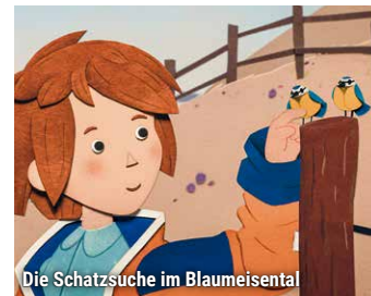
Die Schatzsuche im Blaumeisental