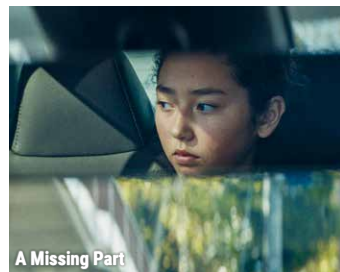
A Missing Part

March liebt einen Staubsauger. Aber nicht irgendeinen. Im Inneren dieses Saugers hat die Seele seiner jung verstorbenen Frau Nat Zuflucht gefunden. Nats Geist sieht zunächst nur er und so ist seine Familie, die eine Haushaltsgerätefabrik führt, entsetzt über diese übernatürliche Beziehung. Und Marchs Mutter tut alles, um der schon zu Lebzeiten ungeliebten Schwiegertochter endgültig den Stecker zu ziehen. Großer Preis der Semaine de la Critique in Cannes 2025.