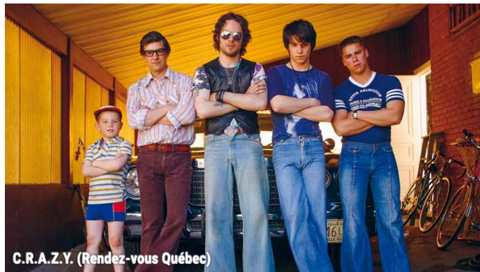
C.R.A.Z.Y. (Rendez-vous Québec)