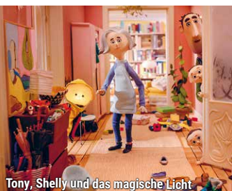
Tony, Shelly und das magische Licht

Die 23-jährige Soo-Ha führt ein ruhiges Leben im südkoreanischen Küstenort Sokcho. Sie jobbt in einer kleinen Pension, in der sich im Winter ein Franzose einmietet. Da nur Soo-Ha Französisch spricht, soll sie sich um den Gast kümmern. Yan Kerrand zeichnet Graphic Novels und seine mysteriöse Energie und seine französische Sprache erwecken Soo-Has Sehnsucht. Sie kennt ihren Vater nicht, ihre Mutter hat ihr nur von einer kurzen Liebe zu einem französischen Hafendarbeiter erzählt.