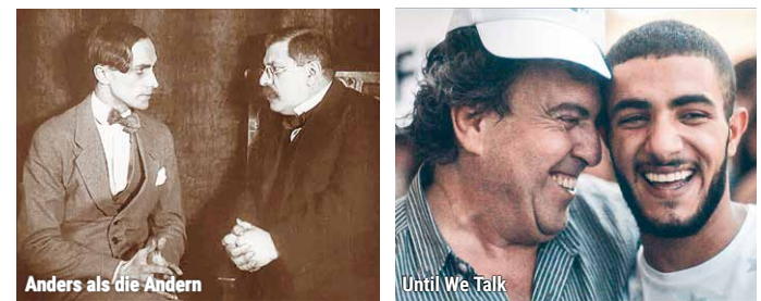
Anders als die Andern

Der Geigenvirtuose Paul Körner verliebt sich in seinen jungen Schüler Kurt Sievers. Ihre romantische Beziehung wird misstrauisch beobachtet. Schwule Beziehungen waren nach §175 eine Straftat, was ein Bekannter dann auch anzeigt. In der Gerichtsverhandlung verteidigt Magnus Hirschfeld, Begründer des ersten Instituts für Sexuallforschung, die homosexuelle Lebensweise. Der Film von Oswald und Hirschfeld war 1919 der weltweit erste Film, der Homosexualität offen thematisierte.