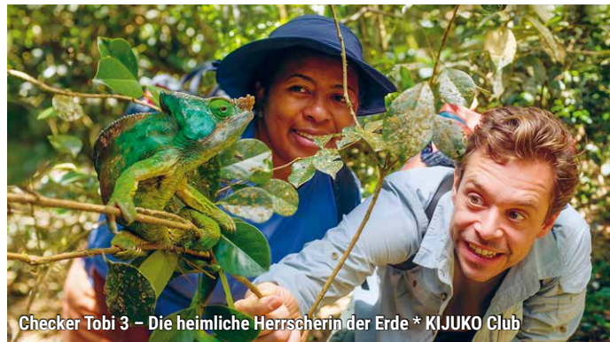
Checker Tobi 3 - Die heimliche Herrscherin der Erde * KIJUKO Club