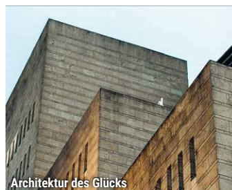
Architektur des Glücks

In Campione d'Italia am Luganer See gab bis vor einiger Zeit das größte Casino Europas, besucht von den Reichen, Berühmten und Schönen. Das arme Fischerdorf wurde 1933 von Mussolini zur italienischen Mustergemeinde umgebaut und fast alle Familien arbeiteten fortan im Casino. Es traf die reichste Gemeinde Italiens ins Mark, als das Casino 2018 Konkurs anmeldete. Seitdem herrschen Arbeitslosigkeit und Tristesse im Ort, überragt vom riesigen leeren Casino-Gebäude.