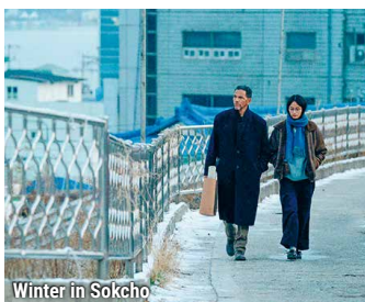
Winter in Sokcho