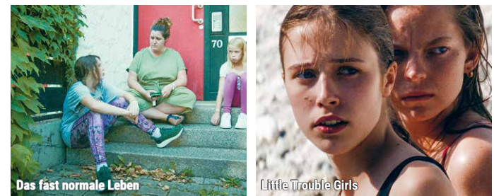
Das fast normale Leben

GEDENKTAG 27. JANUAR • Hannah Arendt - Denken ist gefährlich: Die 1906 in Hannover geborene Autorin, Jüdin und Aktivistin war bereits zu Lebzeiten ein Medienstar. Ihr Eintreten für Freiheit und eine offene Gesellschaft wirkt bis heute nach (D/USA 2025, div. OmU). In Kooperation mit der Landeszentrale für Politische Bildung. Sa. 25.1. bis Mi. 4.2.