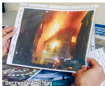
Der zweite Anschlag

GEDENKTAG 27. JANUAR • Fr. 20.2. / 18:00 * mit Einführung und anschließendem Gespräch