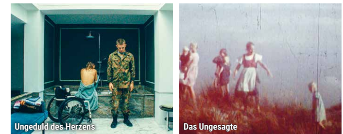
Ungeduld des Herzens

1977 in Brasilien: Seit zehn Jahren herrscht die Militärdiktatur und wer sich nicht regimiekonform verhält, gerät in Lebensgefahr. Auch Marcelo, Technologie-Experte, ist auf der Flucht vor Auftragskillern. In Recife, wo sein kleiner Sohn lebt, taucht Marcelo bei einer exzentrischen Anarchistin unter. Sie hilft ihm und anderen Verfolgten, an gefälschte Papiere zu kommen. Während Marcelo wartet, wird die Situation immer gefährlicher. Goldene Palme in Cannes für die Regie.