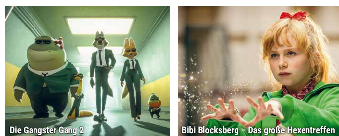
Die Gangster Gang 2

Die Gangster Gang rund um Anführer Mr. Wolf will von nun an einer ehrlichen Arbeit nachgehen. Doch der Arbeitsmarkt ist hart und ihre kriminelle Vergangenheit lässt die Jobsuche nicht einfacher werden. Als auch noch das Gerücht umgeht, die Gangster Gang sei wieder im Geschäft, scheint alles umsonst. Dabei sind es die Gangster Girls mit der Schneeleopardin Kitty Kat als Anführerin, die ihre eigenen Taten der Jungs-Gang anhängen. Sa. 7.2. + So. 8.2. / 15:00 // Sa. 14.2. + So. 15.2. / 15:30