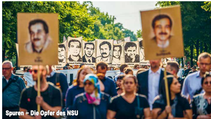
Spuren - Die Opfer des NSU