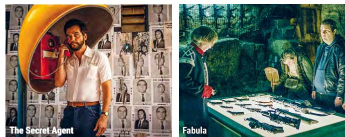
The Secret Agent

Ein Viertel am Rande Athens, das von Kriminalität und Armut gezeichnet ist: Hier ringen die Cousins Reda und Chatila wie hunderttausend andere aus Palästina geflüchtete Menschen mit der gleichen Notlage. Sie wollen ihrem Elend entkommen und hoffen auf eine bessere Zukunft. Sie wollen versuchen, es in Deutschland zu schaffen, wofür sie gefälschte Pässe brauchen. Aber woher das Geld nehmen? Das scheint unmöglich, ohne kriminell zu werden. Premiere in Cannes 2024.