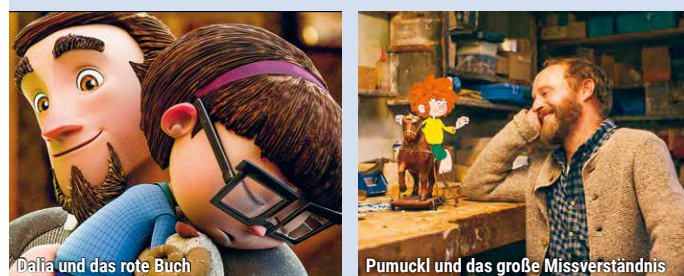
Dalia und das rote Buch

Pumuckl darf mit Meister Eder aufs Land fahren. Der Schreiner soll dort ein altes Karussell reparieren. Pumuckl freut sich auf das »Karuschnell« und muss im Dorf erst einmal alles erkunden. Und er behält eine Bande von Kindern im Auge, die es auf den Maibaum abgesehen haben! Dann meint er zu hören, dass Meister Eder im Dorf bleiben will – ohne ihn! Empört macht er sich allein auf den Nachhauseweg. Sa. 3.1. + So. 4.1. / 15:00 // Sa. 10.1. + 11.1. / 15:30