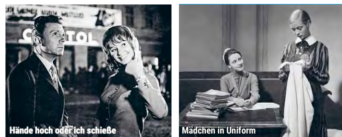
Hände hoch oder ich schieße