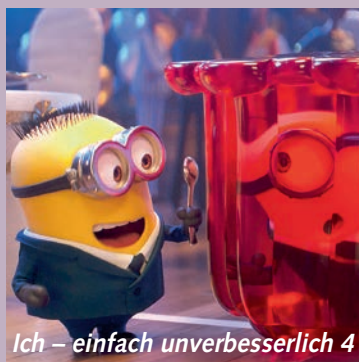
Ich – einfach unverbesserlich 4