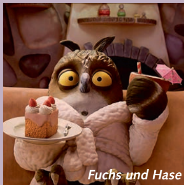
Fuchs und Hase