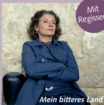
Mein bitteres Land