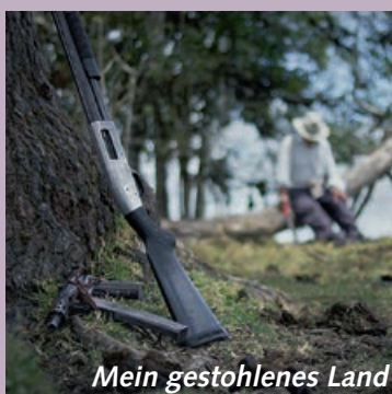
Mein gestohlenen Land