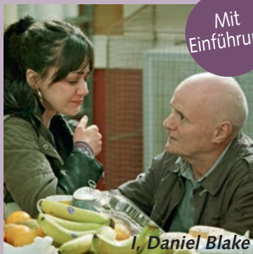
I, Daniel Blake