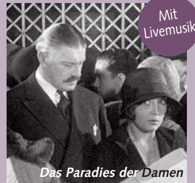
Das Paradies der Damen

Wie entsteht ein urbanes Wir? Bei einem zweitägigen Forum geht es um Ideen für lebenswerte Stadträume: das Kaufhaus namens »Das Paradies der Damen« bedroht im Paris der 1930er kleine Läden; »Wie sieht die ideale Stadt für Euch aus?« behandelt ein Kinder-Workshop; »The Human Scale« zeigt internationale Metropolen im Wandel (mit Diskussion); in sechs Kurzfilmen stellen Bremer*innen Ideen vor (mit Gesprächsrunde). Eine Veranstaltung vom Filmbüro Bremen e.V. Fr. 9.12. / 20:30 // Sa. 10.12. ab 10:00