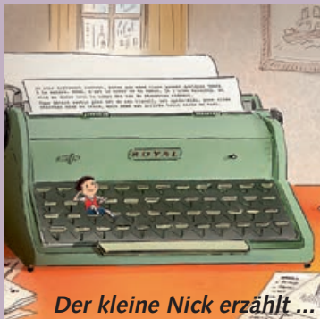
Der kleine Nick erzählt ...