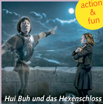
Hui Buh und das Hexenschloss