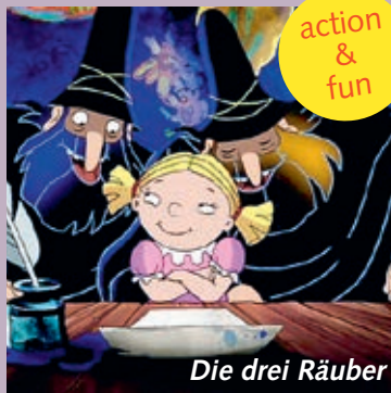
Die drei Räuber