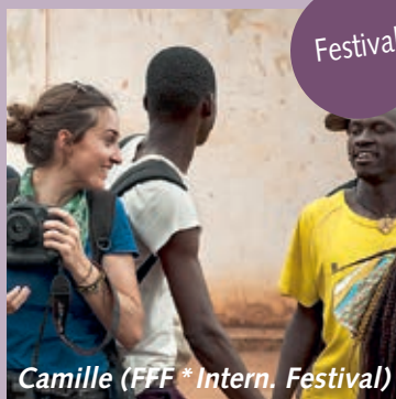
Camille (FFF * Intern. Festival)