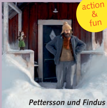
Pettersson und Findus