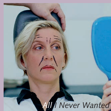
All I Never Wanted

Sa. 22.2. bis Di. 25.2. / 17:30; Do. 27.2. + Sa. 29.2. / 18:00