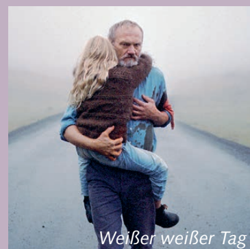
Weißer weißer Tag

Do. 13.2. bis Sa. 15.2. / 17:30; So. 16.2. + Mo. 17.2. / 20:00