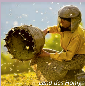
Land des Honigs