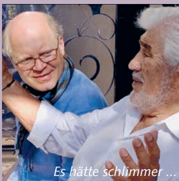
Es hätte schlimmer ...