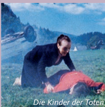
Die Kinder der Toten