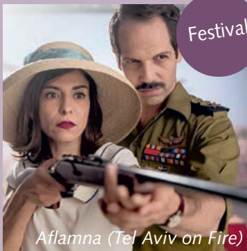
Aflamna (Tel Aviv on Fire)