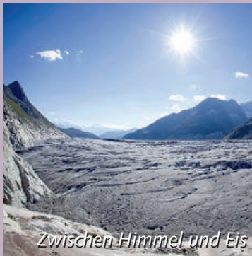
Zwischen Himmel und Eis