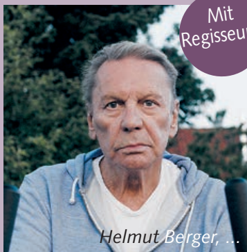
Helmut Berger, ...