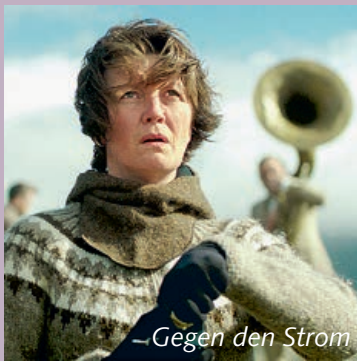
-Gegen den Strom