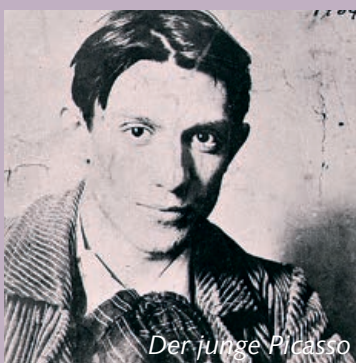
Der junge Picasso