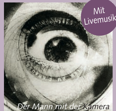
Der Mann mit der Kamera