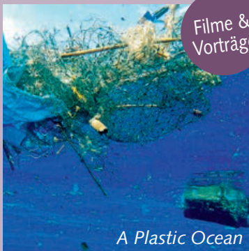
A Plastic Ocean