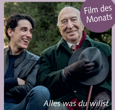
Alles was du willst

Sa. 1.6., Mi. 5.6., Mo. 10.6., Di. 11.6., Mo. 24.6. + Sa. 29.6. / 20:30; So. 2.6., Di. 4.6., Fr. 7.6., Mo. 17.6. + Mi. 26.6. / 18:00