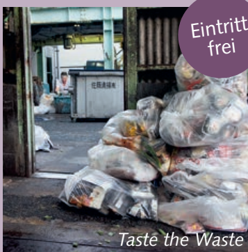
Taste the Waste