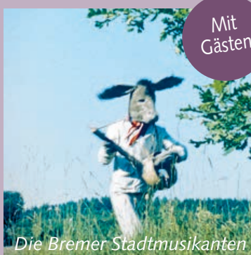
Die Bremer Stadtmusikanten