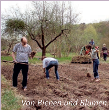
Von Bienen und Blumen