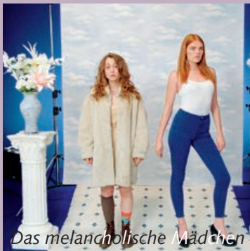
Das melancholische Mädchen