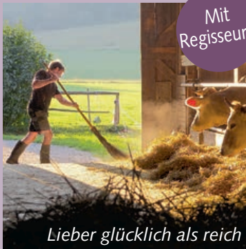
Lieber glücklich als reich