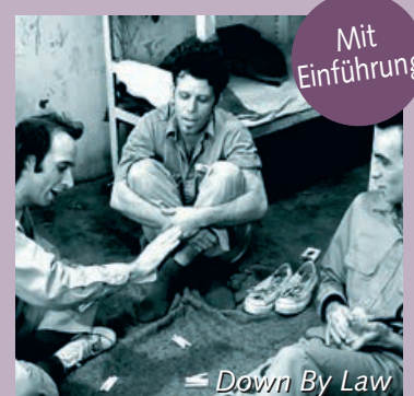
Down By Law