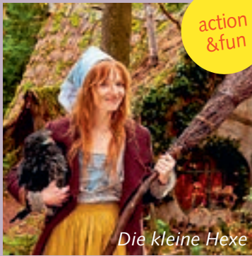
Die kleine Hexe