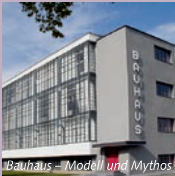
Bauhaus – Modell und Mythos