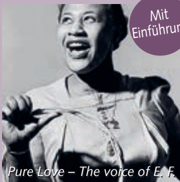
Pure Love – The voice of E. F.