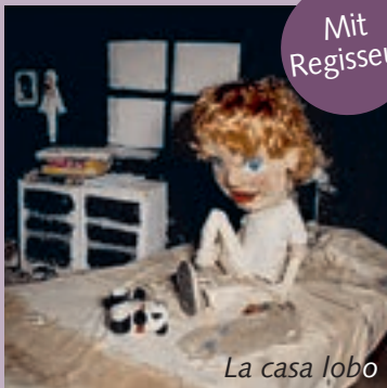
La casa lobo