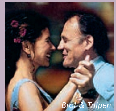
Brot & Tulpen

Als sie von ihrer Familie an der Raststätte vergessen wird, beschließt Rosalba, nicht nach Hause, sondern nach Venedig zu fahren. Sie hat wenig Geld, doch der skurrile Kellner Fernando nimmt sie auf, formvollendet und ausgesprochen höflich. Als Rosalba bei einem Blumenhändler ihren Traumjob findet, verwirft sie alle Pläne, in ihr altes Leben zurückzukehren. I/CH 2000, Regie Silvio Soldini, mit Licia Maglietta, Bruno Ganz, 114 Min., OmU Mo. 1.4. / 20:30; Di. 2.4. + Mi. 3.4. / 18:00; Mi. 10.4. / 15:00