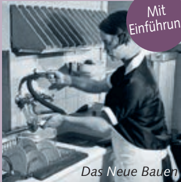
Das Neue Bauen