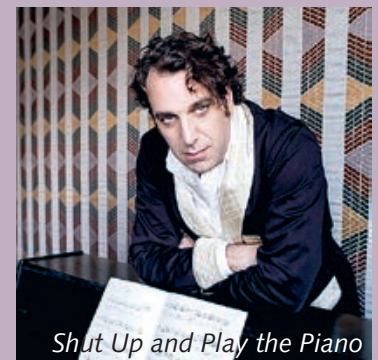
Shut Up and Play the Piano

Do. 20.9., So. 23.9. + Mo. 24.9. / 20:30; Mo. 24.9. bis Mi. 26.9. / 18:00