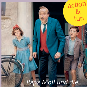
Papa Moll und die ...