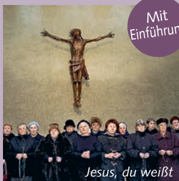
Jesus, du weißt