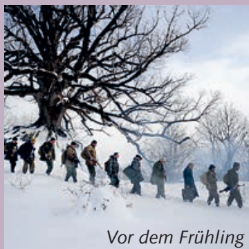
Vor dem Frühling