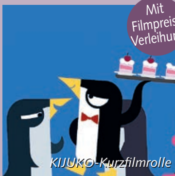
Meine teuflisch gute Freundin