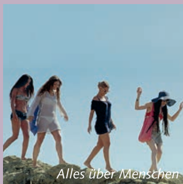
Alles über Menschen