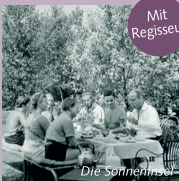
Der letzte Jolly Boy