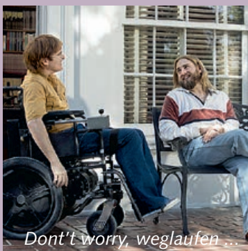
Don't worry, weglafen ...