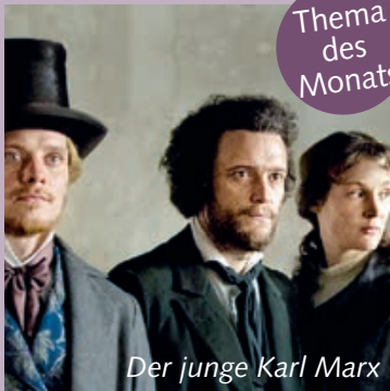
Der junge Karl Marx