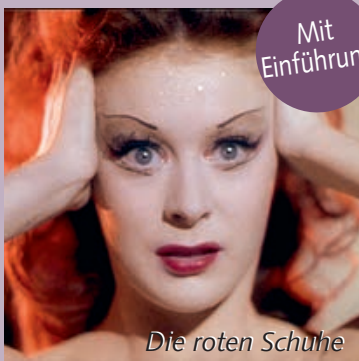
Die roten Schuhe