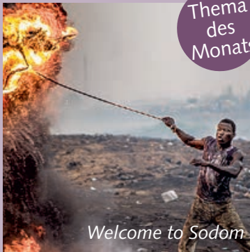
Welcome to Sodom