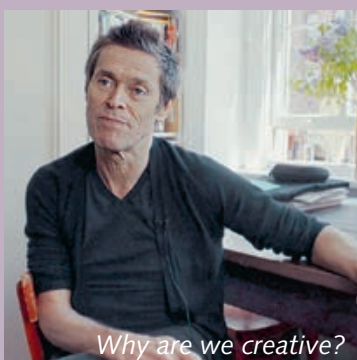
Why are we creative?