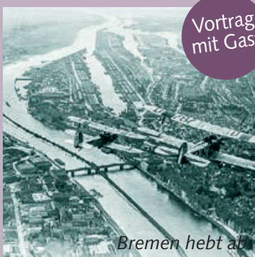
Bremen hebt ab