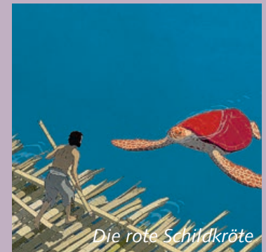
Die rote Schildkröte

Im Januar steht die Filmreihe »Cool Japan« (zur Ausstellung im Übersee-Museum) unter dem Motto Mangas. Als 1989 Akira auf der Berlinale gezeigt wurde, brach in Europa schlagartig Begeisterung für das hier noch fast unbekannte Genre aus. In der langen Manga-Nacht gibt es nun ein Wiedersehen mit zwei Klassikern inklusive Verlosung und weiteren Überraschungen. Den Auftakt macht »Die rote Schildkröte«, der neue große Wurf aus dem legendären Studio Ghibli: Eine moderne Robinsonade um einen Schiffbrüchigen, der von einer roten Schildkröte auf einer einsamen Insel festgehalten wird (F/B/J 2017, R: Michael Dudok de Wit, Sa. 20.1.). Weitere Vorstellungen siehe Homepage. Im Animationsfilm »Das Mädchen, das durch die Zeit sprang« erlangt die 17-jährige Schülerin Makoto bei einem mysteriösen Zwischenfall in der Schule die Fähigkeit, rückwärts durch die Zeit zu »springen«. Sofort nutzt sie die neue Begabung, um ihre Schulnoten zu verbessern oder persönliche Probleme zu lösen. Doch schon bald muss Makoto feststellen, dass es nicht so einfach ist, die Vergangenheit nach den eigenen Vorstellungen zu verändern. Die Zeitreisegeschichte war der Überraschungserfolg des japanischen Kinojahres 2006 (J 2006, R: Mamoru Hosoda, OmU; ab Sa. 27.1.).