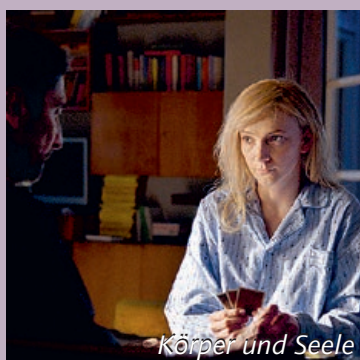
Körper und Seele