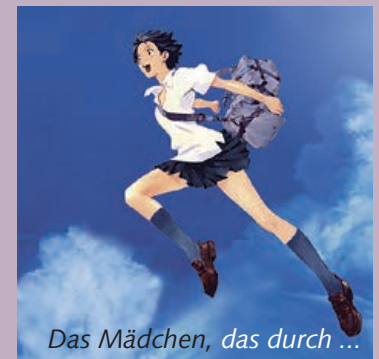
Das Mädchen, das durch ...