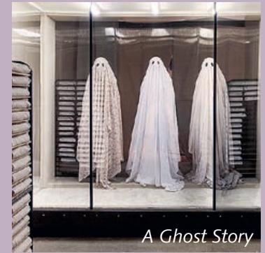
A Ghost Story

Ein junges Paar, »M« und »C«, will gerade in ein neues Haus ziehen, da stirbt »C« bei einem Autounfall. Alles beginnt wie ein ganz gewöhnliches Drama, doch dann kehrt »C« als Gespenst in das gemeinsame Haus zurück. In langen, präzise komponierten Einstellungen erleben wir gemeinsam mit ihm, wie die Zeit vergeht – Tage, Monate, unendlich viele Jahre. USA 2017, Regie: David Lowery, mit Casey Affleck, 92 Min., OmU Mo. 1.1., Di. 2.1., So. 7.1., So. 14.1., Mi. 17.1. + Fr. 26.1. / 20:30; Mi. 3.1., Sa. 6.1., Mi. 10.1., Sa. 13.1., Fr. 19.1., Mi. 24.1. + Do. 25.1. / 18:00